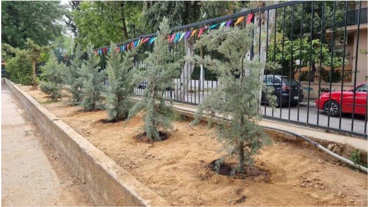
Φυτεύσεις σε σχολεία με δράσεις των Συλλόγων γονέων κ κηδεμόνων – 4ο – 8ο Δημοτικό Σχολείο (ομοίως και στο 5ο Νηπιαγωγείο και 13ο Δημοτικό).