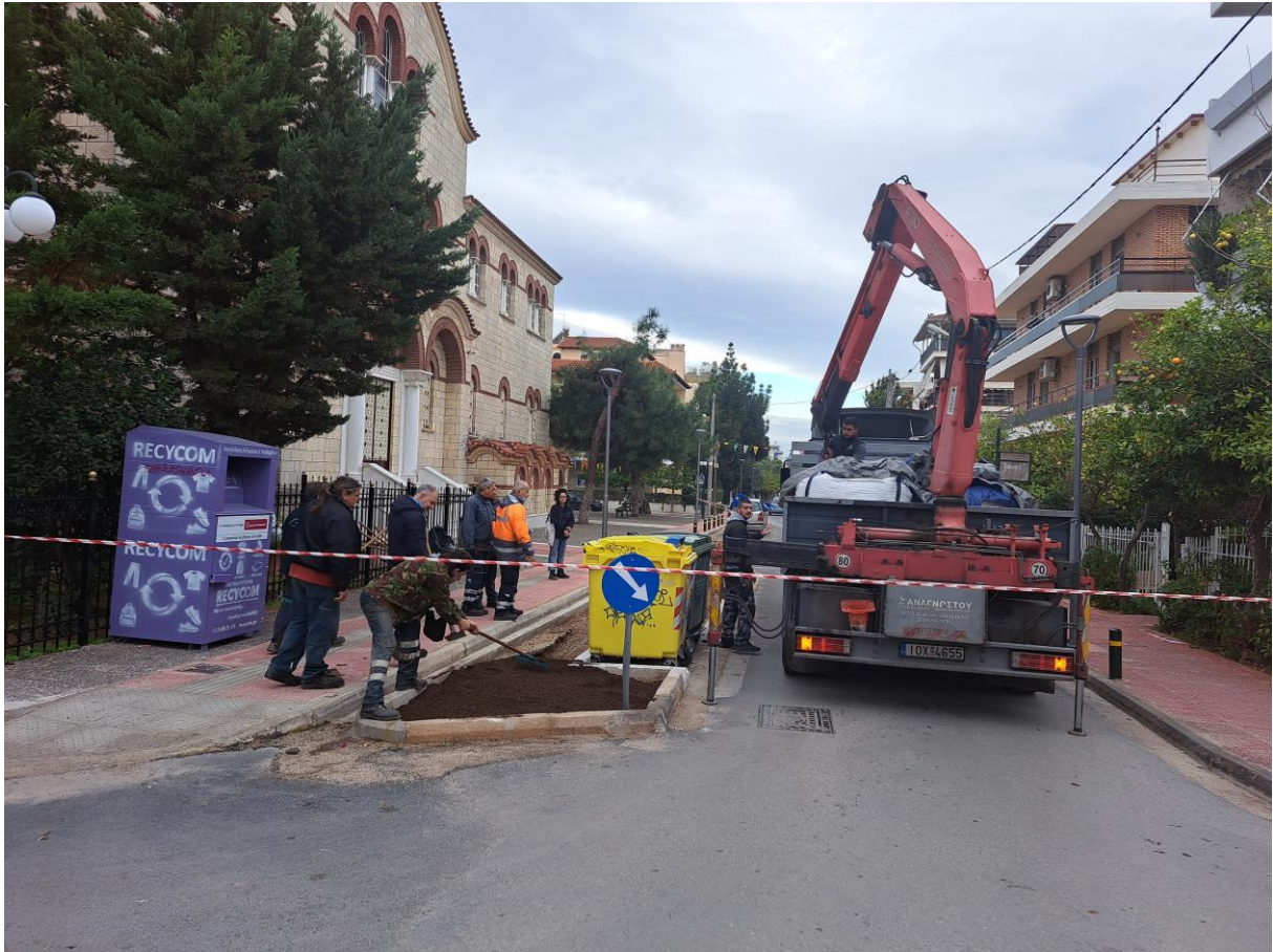
Οδός Ηρ. Πολυτεχνείου – νέα παρτέρια μετά από έργο – προμήθεια κ εγκατάσταση κηπευτικού χώματος