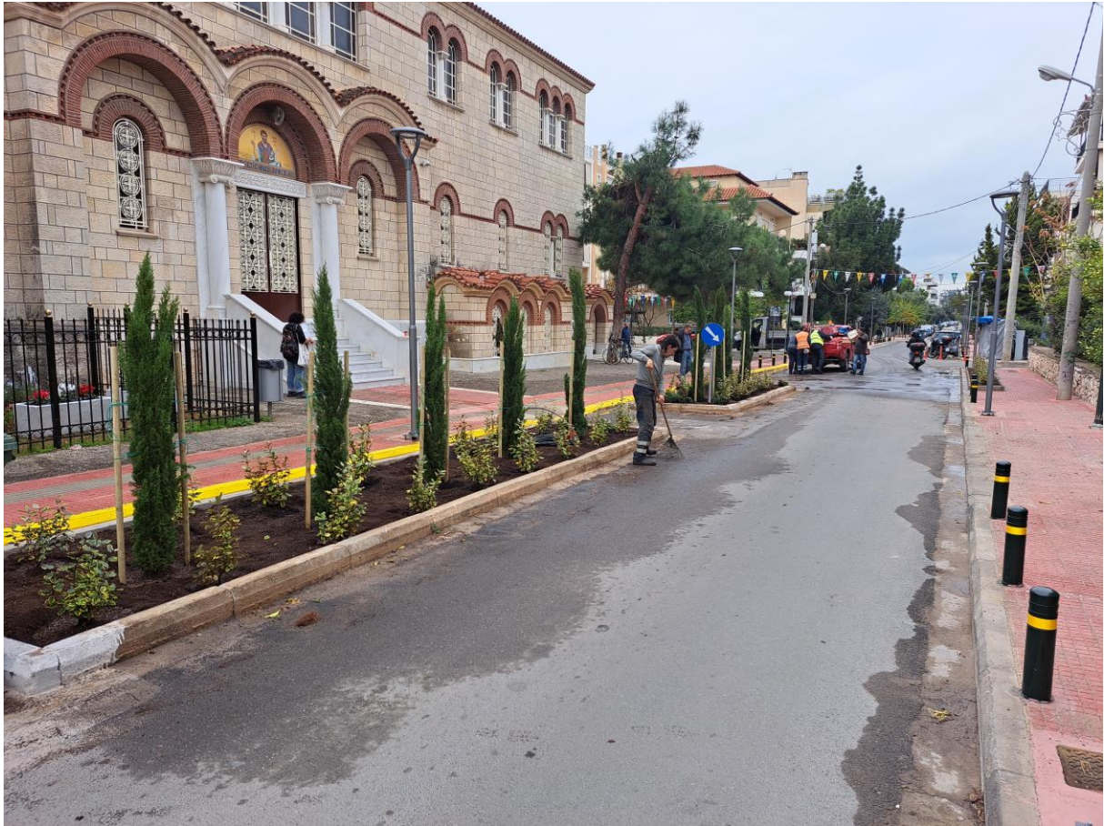
Οδός Ηρ. Πολυτεχνείου – νέα παρτέρια μετά από έργο – – ολοκληρωμένη φύτευση έξω από τον Ι.Ν. Αγ. Ελευθερίου