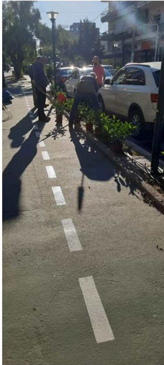
Ανανέωση και πύκνωση φύτευσης στα παρτέρια επί της οδού Αγ. Παρασκευής