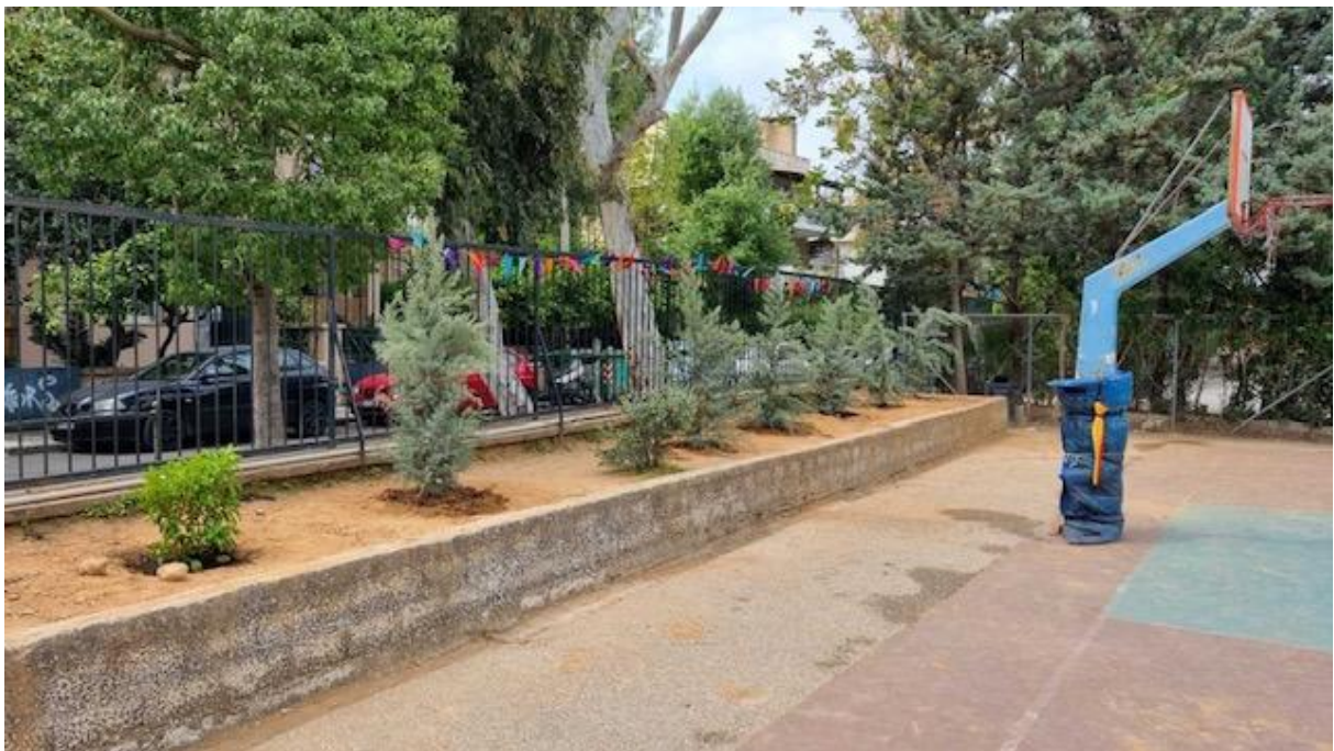
Φυτεύσεις σε σχολεία με δράσεις των Συλλόγων γονέων κ κηδεμόνων – 4ο – 8ο Δημοτικό Σχολείο (ομοίως και στο 5ο Νηπιαγωγείο και 13ο Δημοτικό).