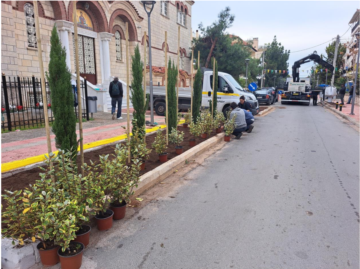
Οδός Ηρ. Πολυτεχνείου – νέα παρτέρια μετά από έργο – φυτεύσεις μετά εγκατάσταση κηπευτικού χώματος