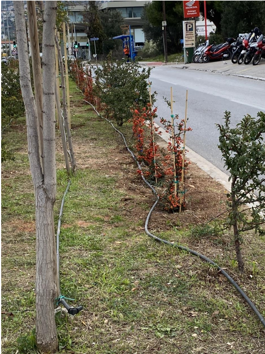
Οδός Ηρακλείτου – συμπληρωματικές φυτεύσεις σε νησίδες Ηρακλείτου & Αναπαύσεως με επισκευές των δικτύων άρδευσης καθ' όλη τη διάρκεια του έτους