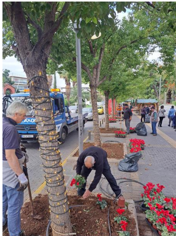
Κεντρική Πλατεία – φυτεύσεις εποχιακών ανθόφυτων ανανεούμενες κατά τη διάρκεια όλου του έτους