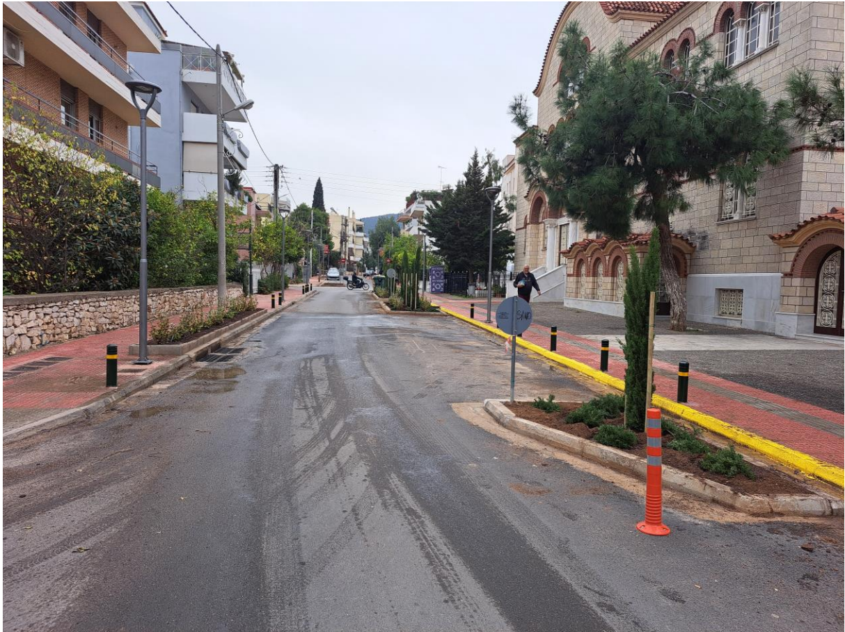
Οδός Ηρ. Πολυτεχνείου – νέα παρτέρια μετά από έργο – – ολοκληρωμένη φύτευση έξω από τον Ι.Ν. Αγ. Ελευθερίου