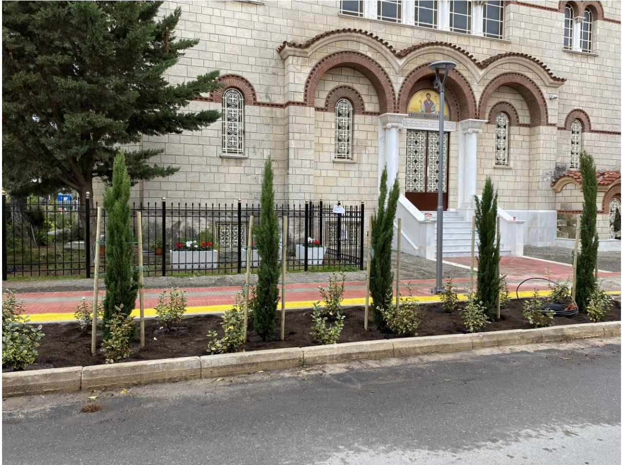
Οδός Ηρ. Πολυτεχνείου – νέα παρτέρια μετά από έργο – ολοκληρωμένη φύτευση έξω από τον Ι.Ν. Αγ. Ελευθερίου