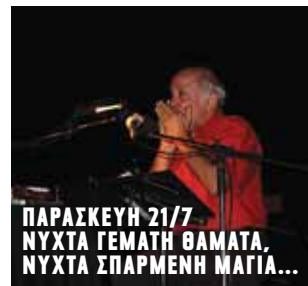
ΠΑΡΑΣΚΕΥΗ 21/7 ΝΥΧΤΑ ΓΕΜΑΤΗ ΘΑΜΑΤΑ, ΝΥΧΤΑ ΣΠΑΡΜΕΝΗ ΜΑΓΙΑ...