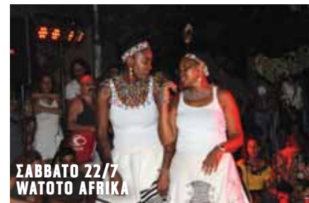
ΣΑΒΒΑΤΟ 22/7 WATOTO AFRIKA

Το πρόγραμμα περιλαμβάνει επίσης παλιές και νέες συνθέσεις του Δημήτρη Ζαφειρέλη.