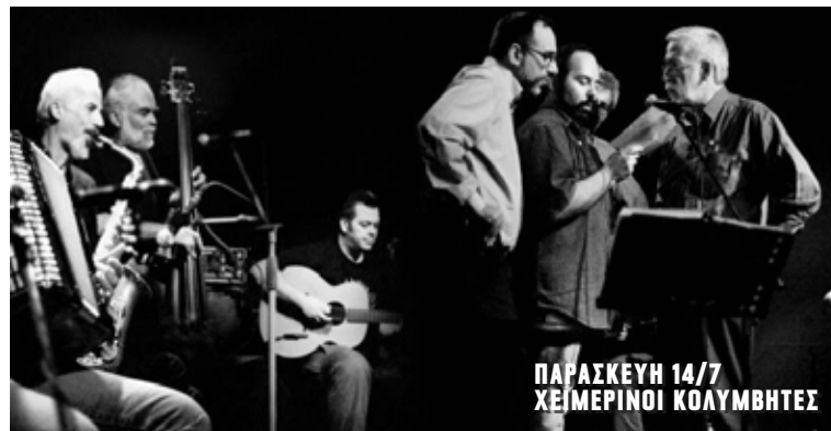
ΠΑΡΑΣΚΕΥΗ 14/7 ΧΕΙΜΕΡΙΝΟΙ ΚΟΛΥΜΒΗΤΕΣ