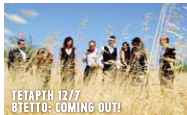
ΤΕΤΑΡΤΗ 12/7 8ΤΕΤΤΟ: COMING OUT!