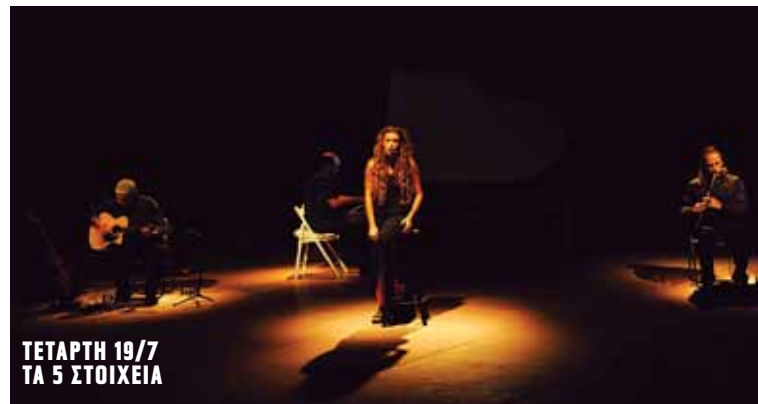
ΤΕΤΑΡΤΗ 19/7 ΤΑ 5 ΣΤΟΙΧΕΙΑ

Το New Group με rock καταβολές σε μια συναυλία που περνάει πολύ εύκολα από τα blues στην Jazz και τη soul.